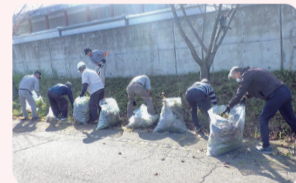
清掃ボランティア(社会奉仕活動)