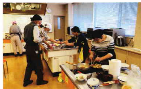
▲家事援助調理講習会

献立は旬の食材を使い「大根と豚肉の甘辛炒め」「いもごはん」「レタスチーズサラダ」などを作りました。