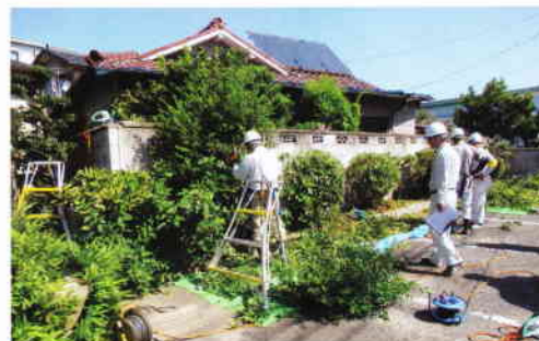
▲安全委員によるパトロール

9月26日(木)、市シルバー人材センターの安全委員会(理事4名と事務局)による安全就業パトロールが、個人宅での庭木せん定と草刈り作業で実施され、作業看板の有無や飛び石対策などの点検が行われました。