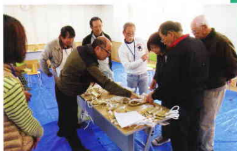
◀わらじづくり講座