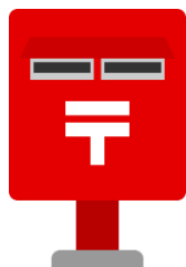
往復はがきの投函