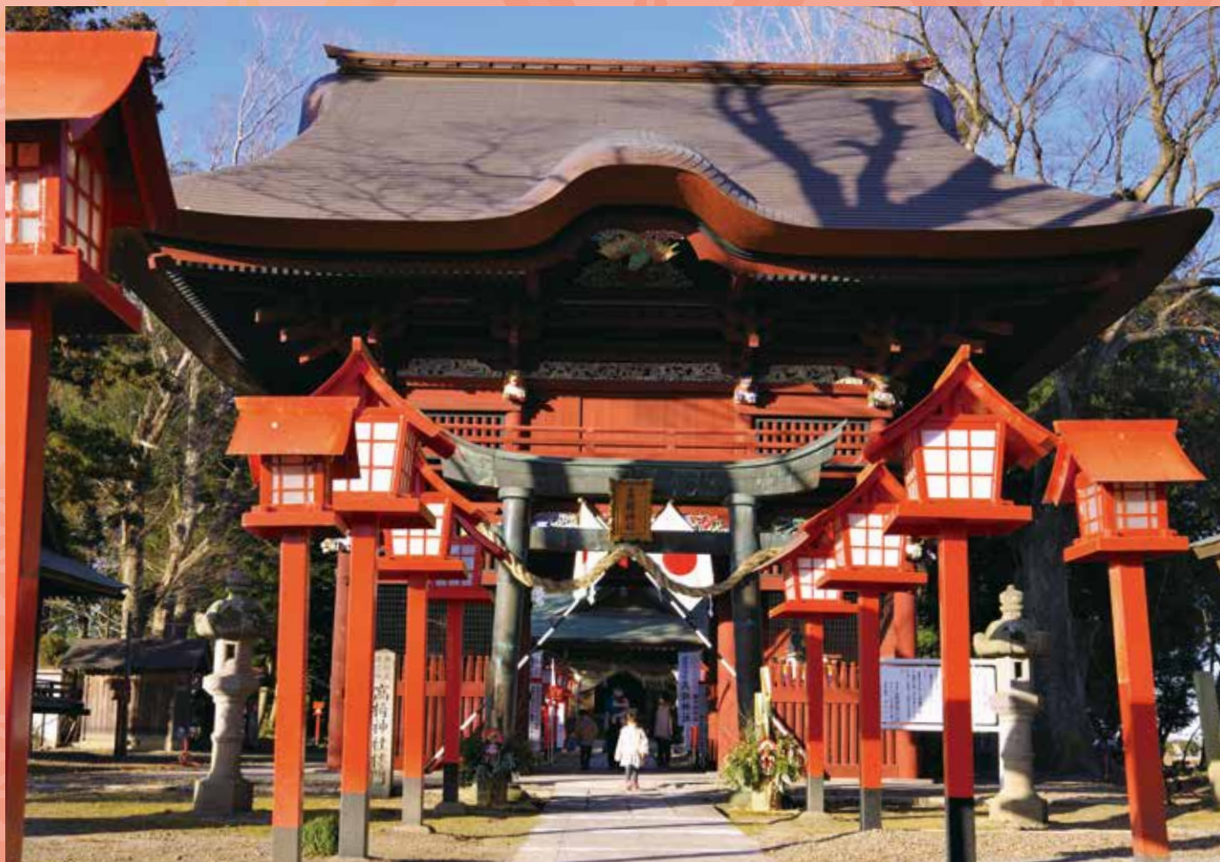
栃木県有形指定文化財「高椅神社楼門」