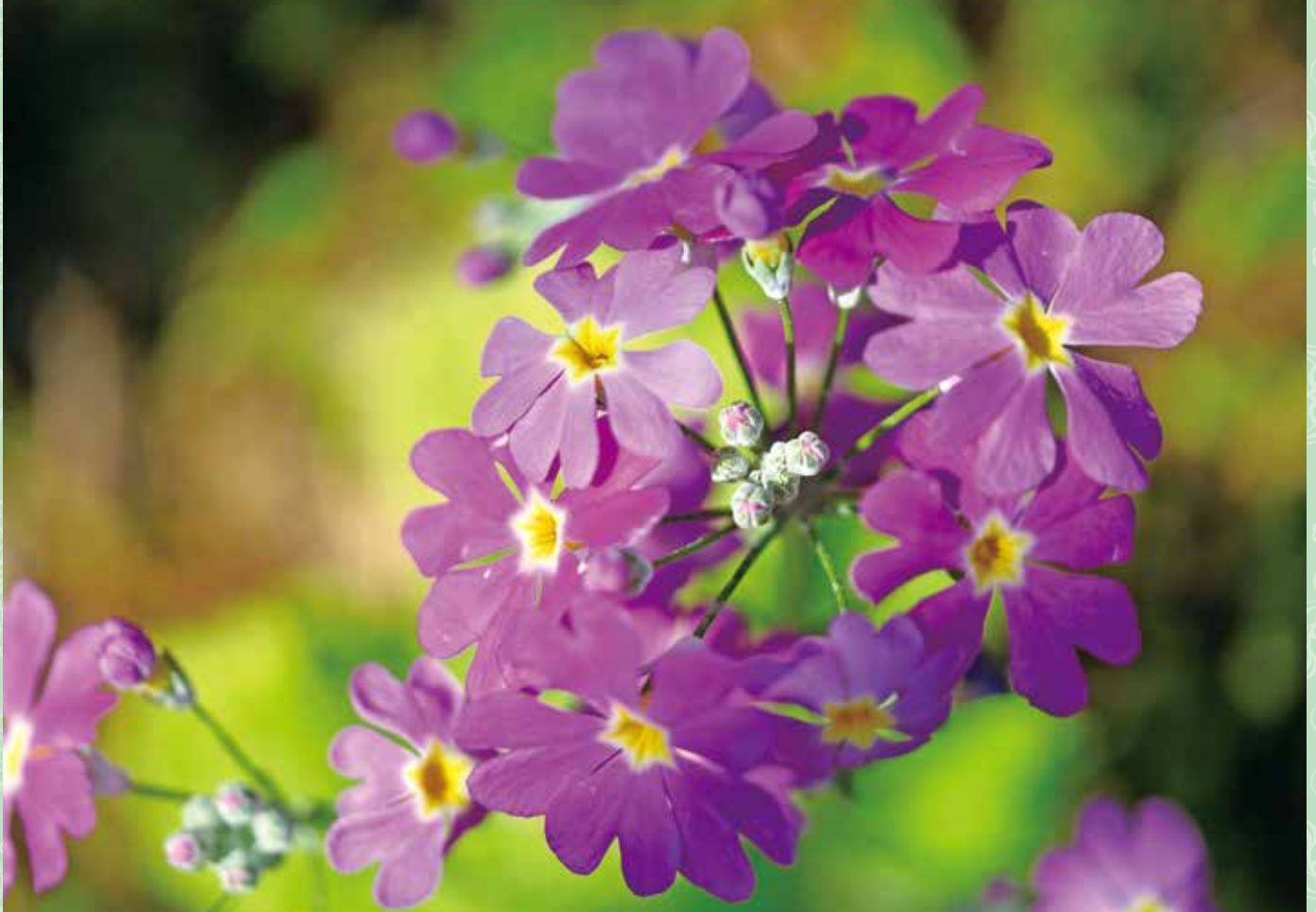
クリンソウ