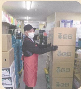
荷受け作業(スーパー)