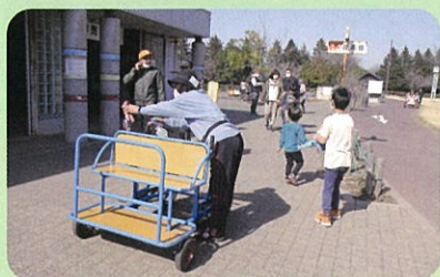
公園の自転車貸し出し