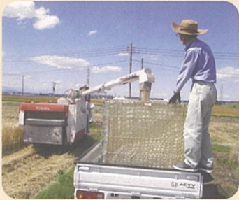
麦の収穫の手伝い