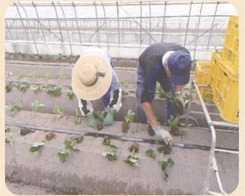
イチゴの定植の手伝い