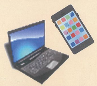
パソコン・スマホでの 困りごとの解決やレッスン