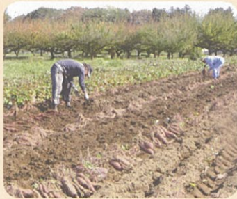
サツマイモの収穫のお手伝い