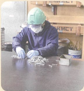
工場内作業(部品整理)