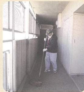
マンションの清掃