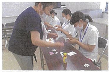
▲折り紙ブロック作り

看護学生がシルバー会員との関りや活動の体験を通して、高齢者の生きがいや楽しみを学ぶことを目的としておこなっています。