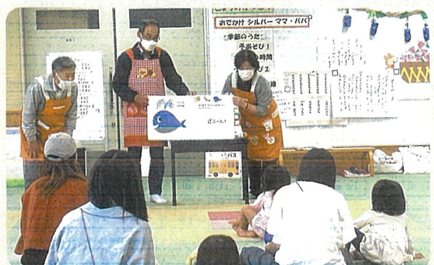
お出かけシルバーママ・パパ R6.11.12