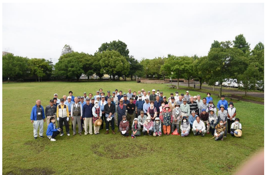
(令和5年 春の奉仕活動集合写真)

昨年(令和5年度)は、予定の日が雨で翌日に延期したにもかかわらず、約80名の会員さんに参加いただきました。今年度も、多くの会員さんの参加をお願いします。