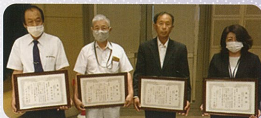
安全就業スローガン入賞者