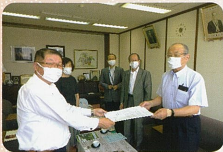
伊東町長と山口会長