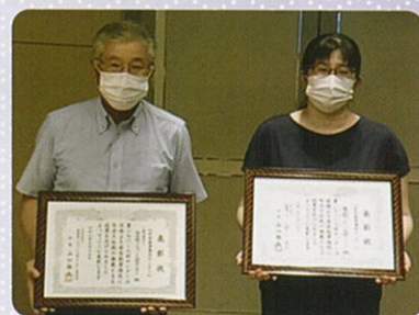
安全優良センター