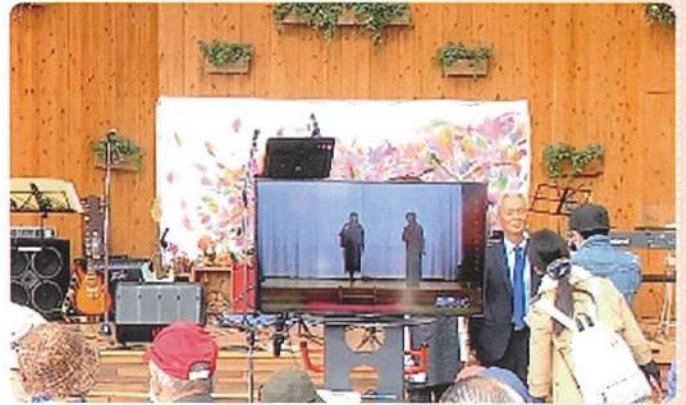
佐賀市SC・鳥栖市SCの会員による ファッションショーのビデオ放映