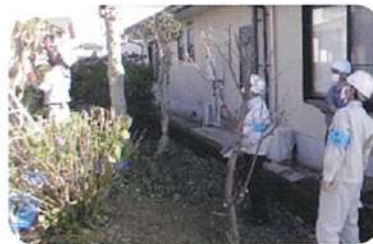
剪定（鳥栖市蔵上町）

このため、各現場の点検終了後、事務所に帰り全委員による意見集約を行いました。特段の指摘事項はありませんでした。