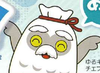
ゆるキャラ チエブクロ