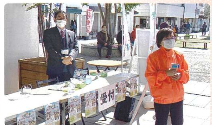
入場時の検温とアルコール手指消毒