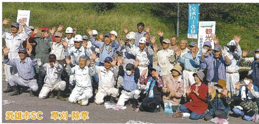
武雄市SC 草刈・除草