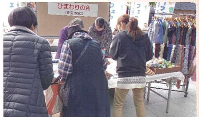
佐賀市SC「ひまわりの会」出展