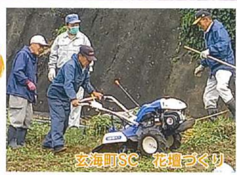
玄海町SC 花壇づくり