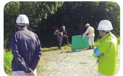
草刈（鳥栖市山浦町）