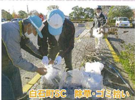
白石町SC 除草・ゴミ拾い