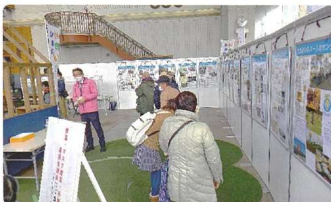
各センター パネル展示