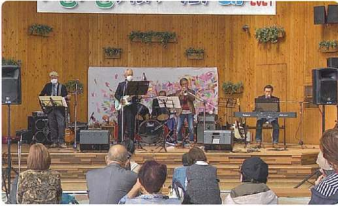
バンド演奏：ザ・マンスタース