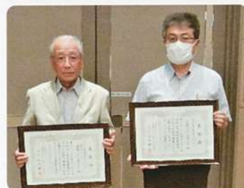
安全就業優良センター 嬉野市SC 太良町SC