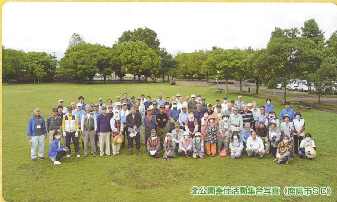
北公園奉仕活動集合写真 (鹿島市SC)