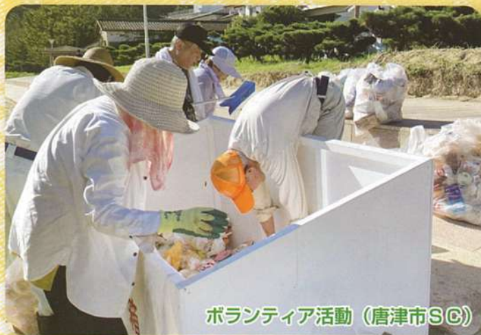
ボランティア活動 (唐津市SC)