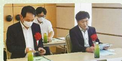
佐賀労働局 県産業人材課 白仁田様 原田様