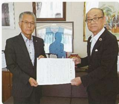
馬場議長と山口会長