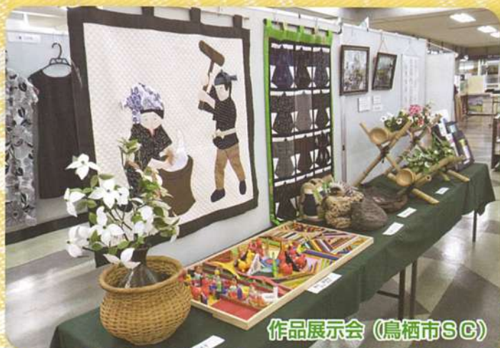
作品展示会 (鳥栖市SC)