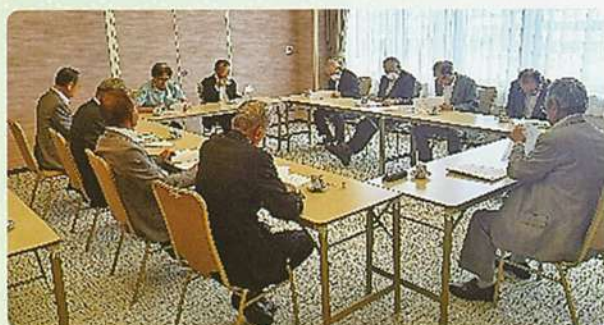
総会終了後開催の臨時理事会