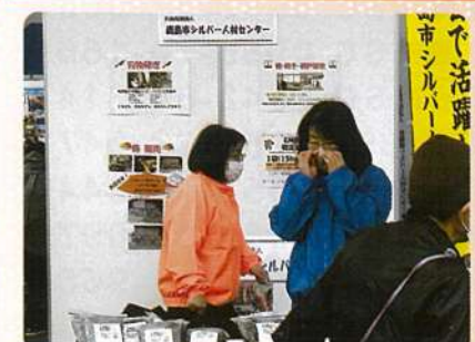
剪定枝葉チップの無料配布 鹿島市SC