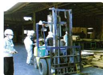
清掃作業（有田町内製材所）