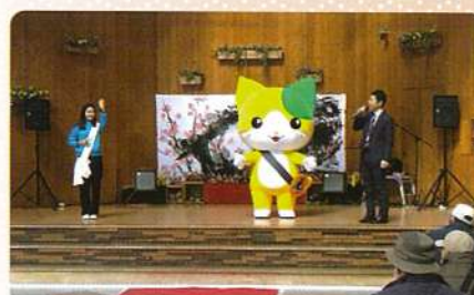
サガブループロジェクトPR