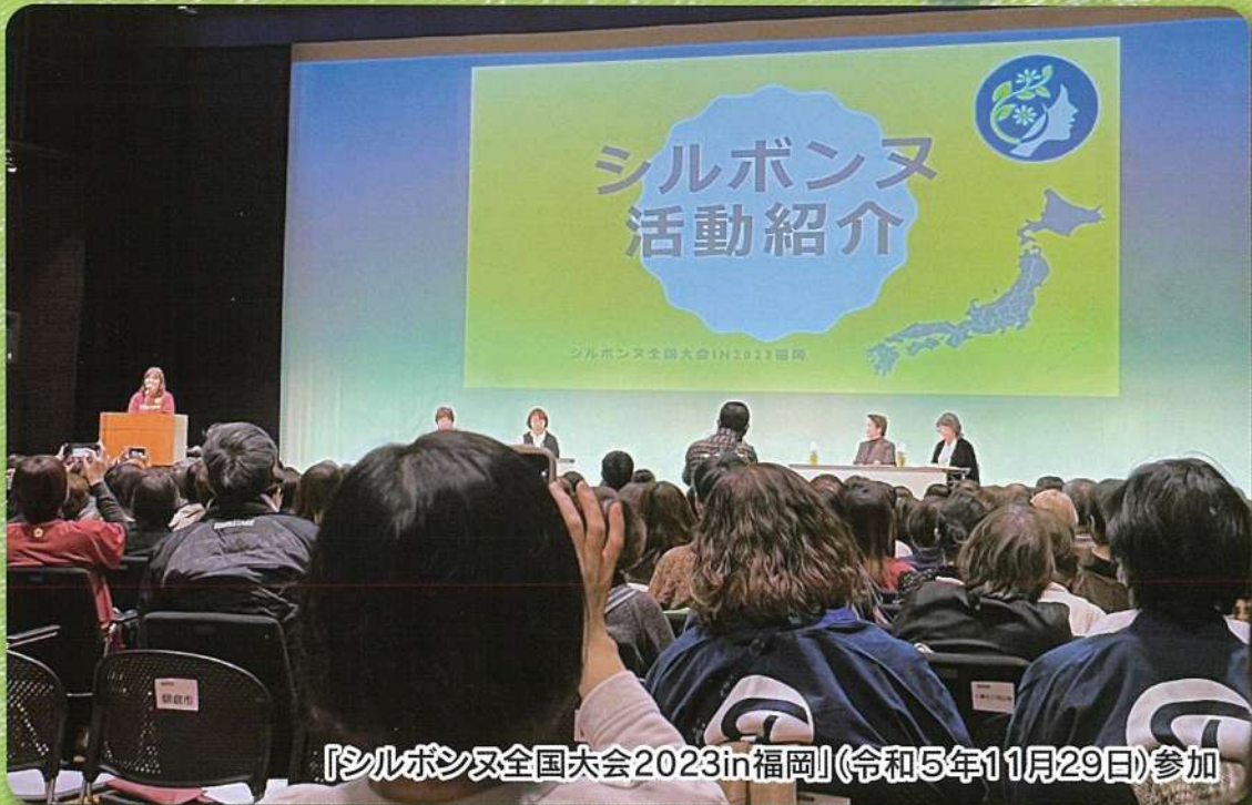
『シルボンヌ全国大会2023in福岡』(令和5年11月29日)参加