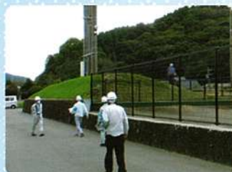
草刈作業（有田赤坂球場）