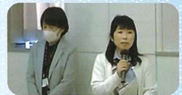
松岡指導員様 北御門課長様