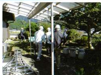
剪定作業（有田町内民家）