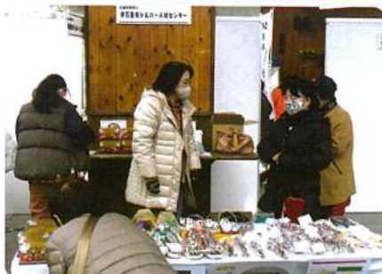
ひな人形・小物販売 伊万里市SC