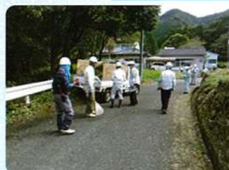
草刈作業（有田町町道）