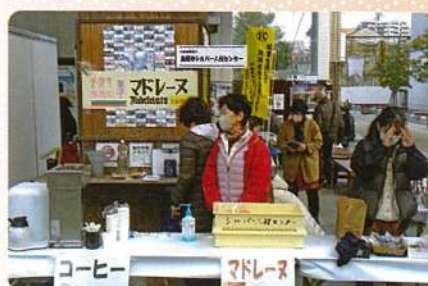
マドレーヌ等販売 鳥栖市SC