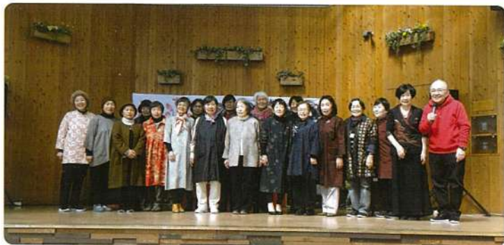
佐賀市・鳥栖市SC会員によるファッションショー