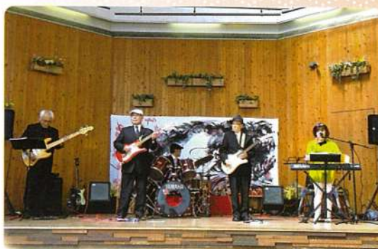
佐賀市SC会員中心のバンド演奏 (ドリーマーズ)