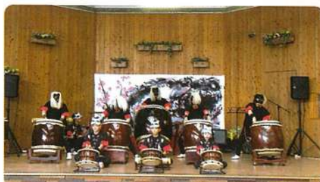
和太鼓演奏 (葉隠太鼓保存会)