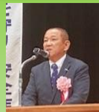
本村 賢太郎 相模原市長