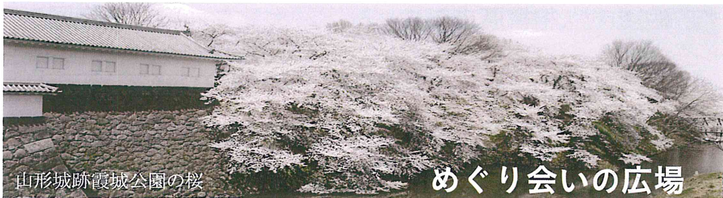
山形城跡霞城公園の桜