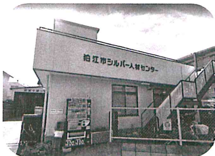
狛江市シルバー人材センター

会員と役員、事務局が三位一体で運営を行い、特にPR活動には力を注ぎ、夏の“いかだレース”では青年隊、乙女隊は毎年出場しています。ほかに、ダンシングチームの踊りや、ハンドネイル講習会などを行っています。