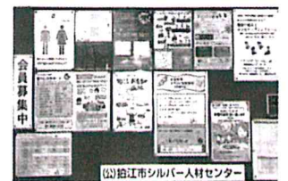
いろいろな催しの広報版