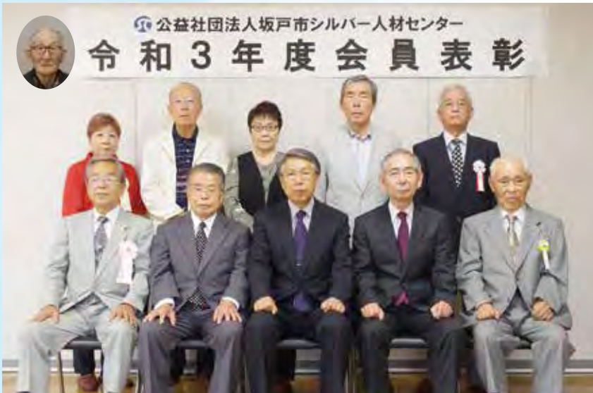
受賞者の皆様、おめでとうございます。

(一) 監査報告について (二) 令和2年度事業報告について (三) 令和3年度事業計画書、収支予 算書、資金調達及び設備投資に ついて