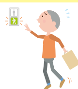
横断歩道を青信号で 渡りきれない