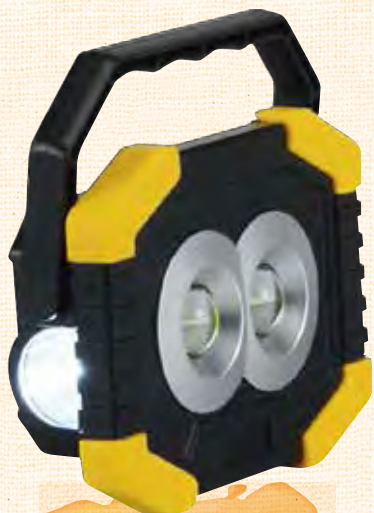
記念品 LEDワークライト

を目標して会員紹介キャンペーンを実施します。近年会員数が減少しており、就業を通じて地域社会に貢献し、地域住民などの期待に応えるためには会員数を増やしていく必要があります。