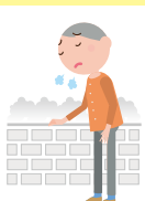
15分続けて歩けない