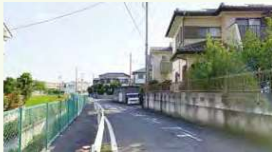
浅羽野地区の住宅地

当日は生憎の雨だったため、後日、会員増強と就業確保を願い、各人100枚、合計900枚のチラシを個々にポストイングしました。