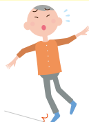
家の中でつまずいたり 滑ったりする