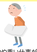
家のやや重い仕事が困難 （掃除機の使用、 布団の上げ下ろし）