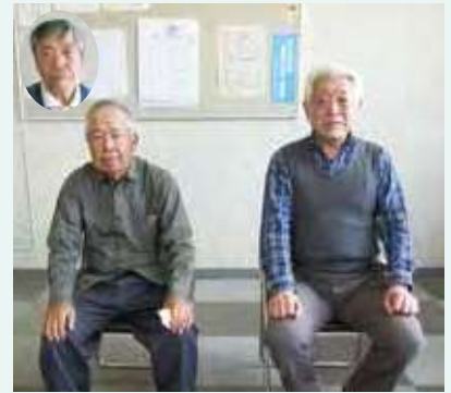
除草班・受付清掃班