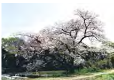
【一本桜】 『高麗川二号堰にて』

無理をせず楽しみながらできるといいですね。運動すればちゃんと体は変わっていきます。