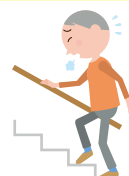
階段を上がるのに 手すりが必要