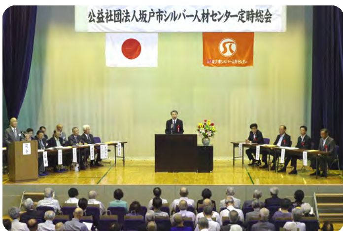
昨年度定時総会風景