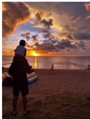
沖縄にて