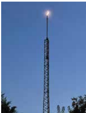
塔の上の月