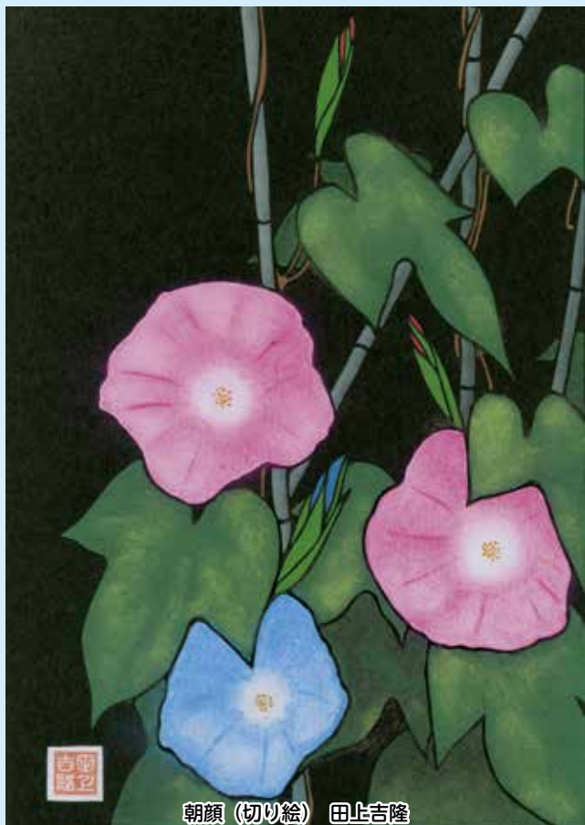
朝顔(切り絵) 田止吉隆

公益社団法人 坂戸市シルバー人材センター 〒350-0212 坂戸市大字石井2327-5 TEL(283)5544(代表) FAX(289)3733 企画・編集 広報部会