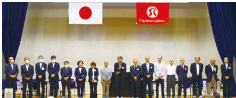
■総会で選任された役員■