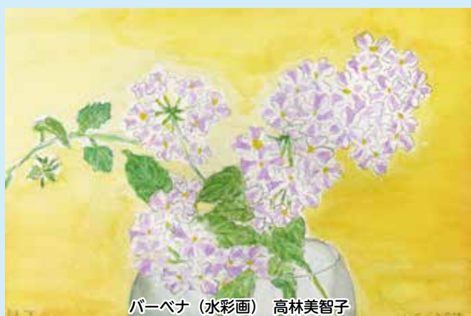
バーベナ(水彩画) 高林美智子