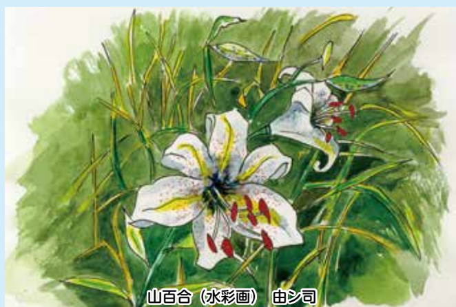
山百合(水彩画) 由シ司