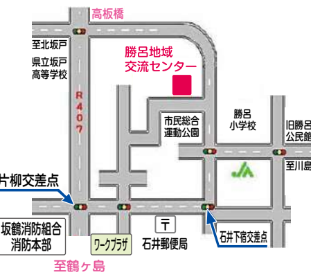
勝呂地域交流センター案内図

期日：令和6年6月15日(土) 時間：13時30分開会 会場：勝呂地域交流センター (旧：勝呂公民館)