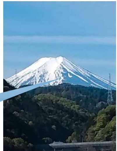
富士山「農鳥」出現・田植え近し！