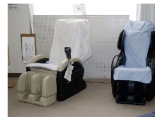
■マッサージチェア