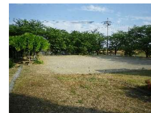
■ゲートボール場(2面)