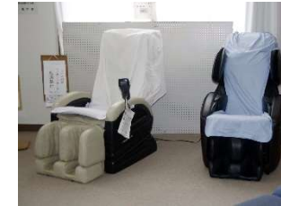
■マッサージチェア