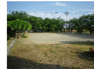
■ゲートボール場（2面）