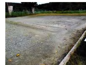
■ゲートボール場（2面）