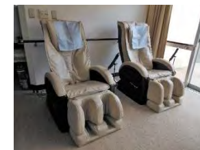
■マッサージチェア