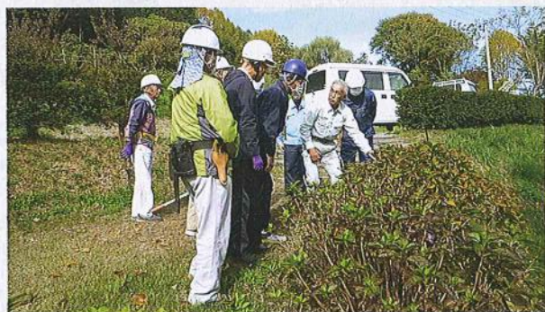
昨年の講習会の様子