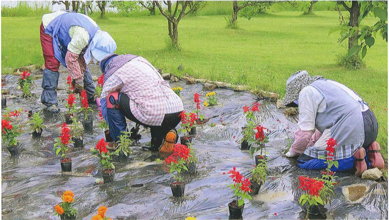
リサーチパーク内の企業花壇整備の様子