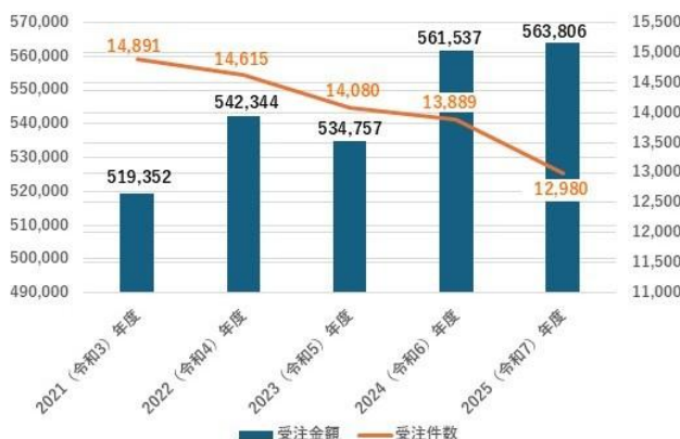
受注金額と受注件数の推移