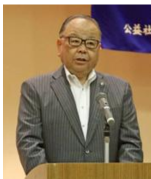
西田三十五 佐倉市長