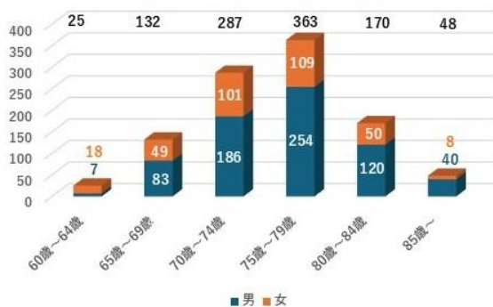
年齢層別会員数(令和8年3月末日現在)