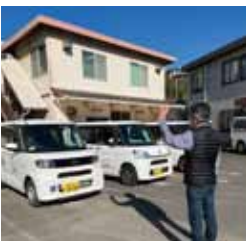
出発前に車両の安全点検