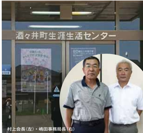
村上会長(左)・嶋田事務局長(右)