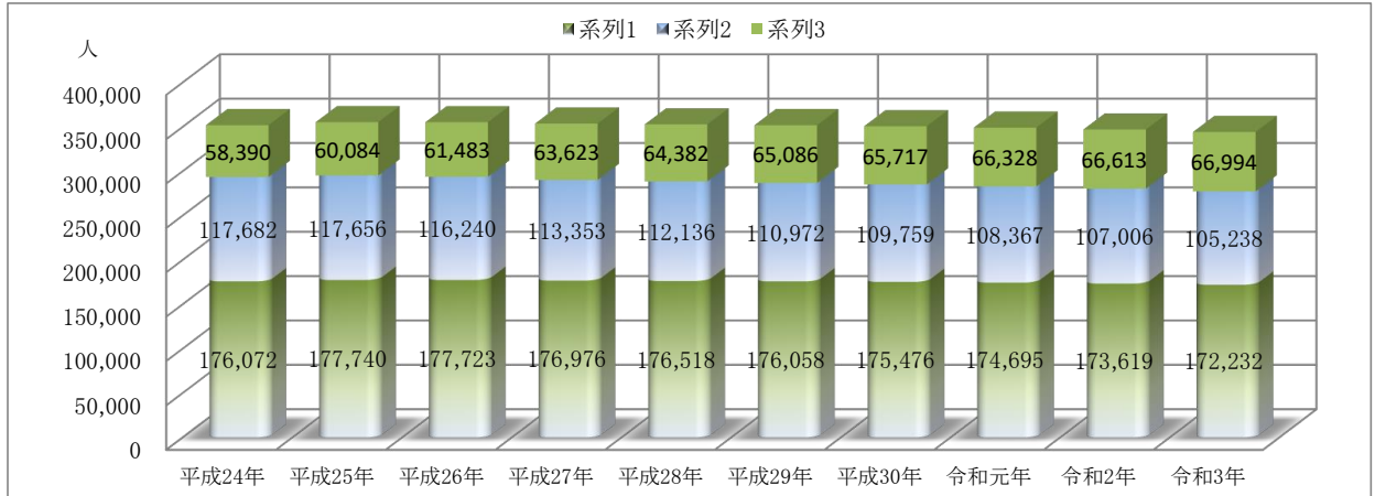
表2 佐倉市の人口推移