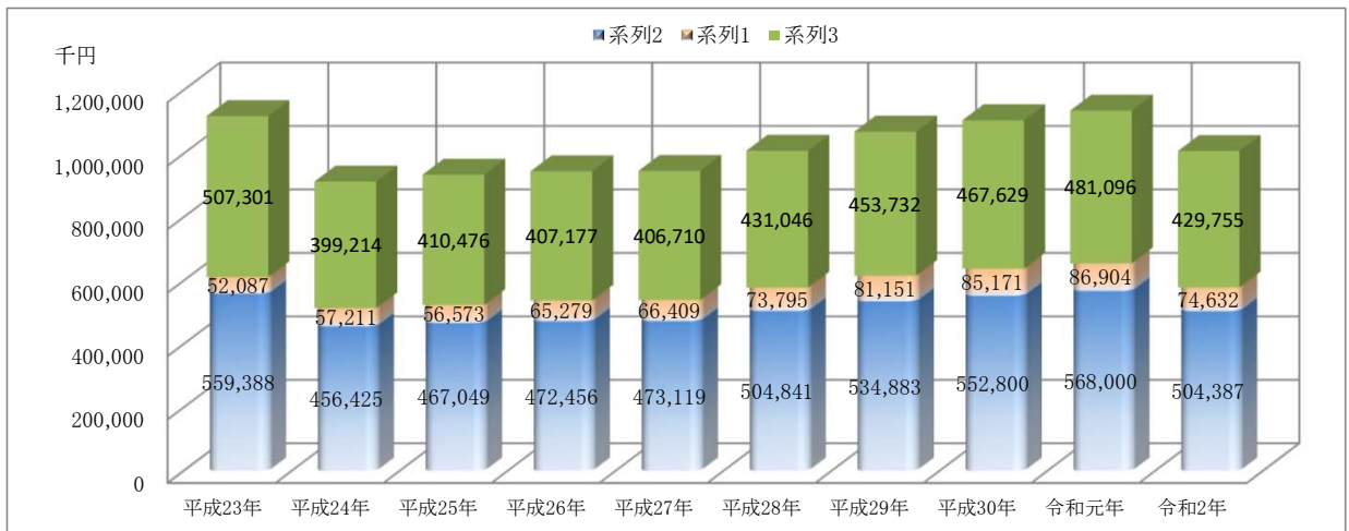
表5 受注金額(公共・民間)の推移