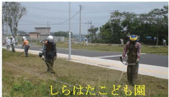
しらはたこども園