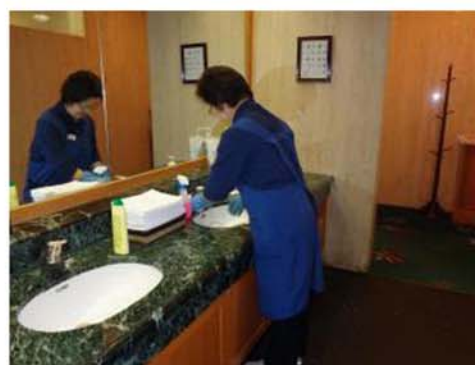
トイレ洗面台清掃