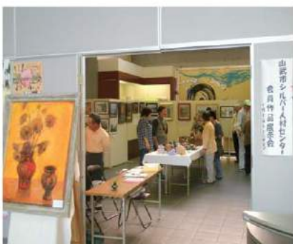
昨年の展示会模様