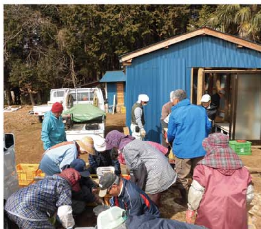
ジャガイモ 種いも準備