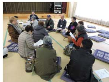
蓮沼地区地域班懇談会

この会員更新説明会は、入会取扱要綱により定められ、出席の必要がある大切な会合です。自分の地区で都合が合わないときは、他の地区で出席するように調整を各自でお願いします。