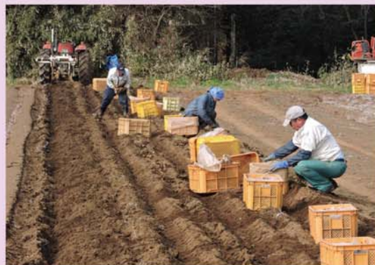
農作業（大和芋の収穫）