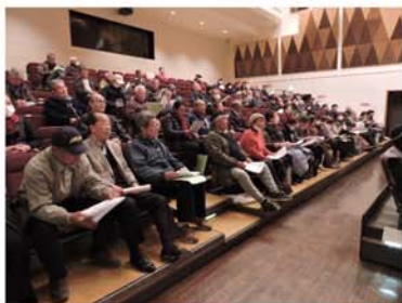
山武地区更新説明会

二月四日から各地区において、平成三十九年度会員更新説明会及び地域班懇談会を実施しました。