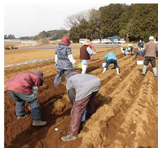
ジャガイモ 種いも植付