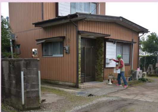
暮らしの便利帳 戸別配布