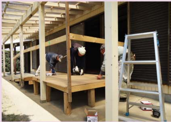
選挙投票所仮設通路設置