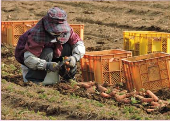
農作業（人参の葉切り）

シルバーでは、さまざまな職種の仕事をしています。今回、八つの就業現場を紹介しています。