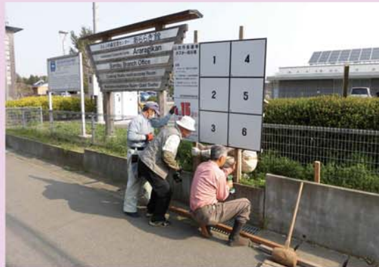
選挙ポスター掲示板設置・撤去