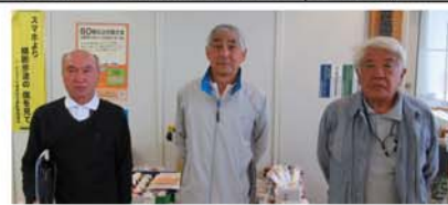
山武草刈・植木班、松尾蓮沼草刈班