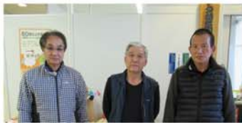
軽作業 パトロール班