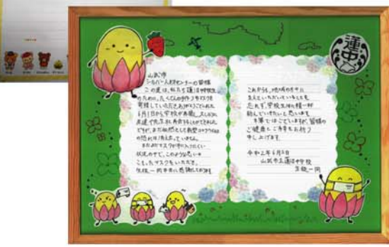
生徒からのお礼の手紙