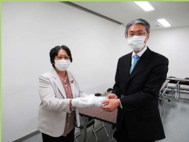
教育委員会へ納品