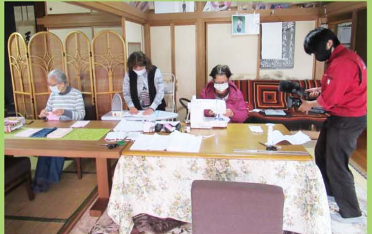
ケーブルネット296の取材

市からの要望を受け、独自事業「すみれサークル」有志のメンバーで、困っている方々のお役に立てればと、さらしの布マスクを製作しました。