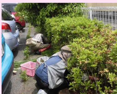
公共施設の草取り

草取り・屋内外清掃・家事援助サービス・ママ家事サポート・広報紙全戸配布・市役所受付業務等をおこなっています。多くの女性会員が活躍しています。