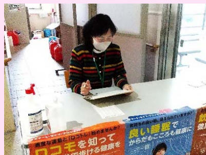
ワクチン接種受付