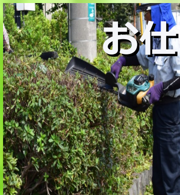
庭木の剪定・刈込