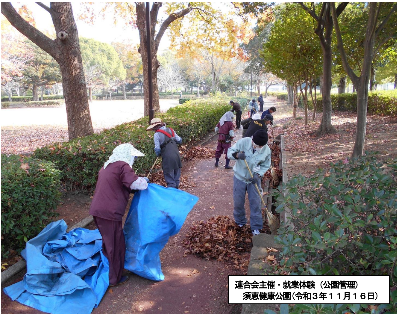
連合会主催・就業体験（公園管理） 須恵健康公園（令和3年11月16日）