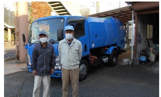
9日 連合会主催・刈払講習／宇部市