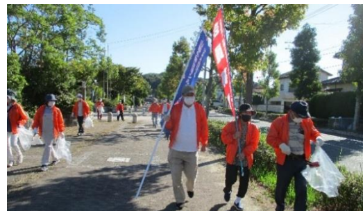
▲市民館周辺道路清掃