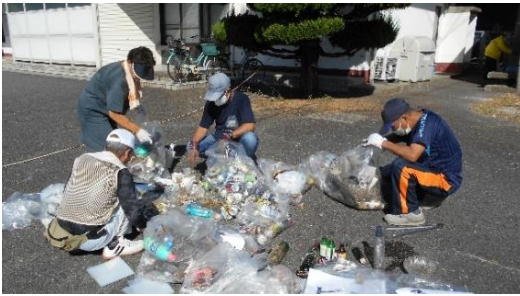
▲埴生駅周辺道路清掃