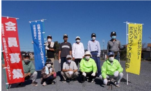
▲厚狭駅周辺道路清掃