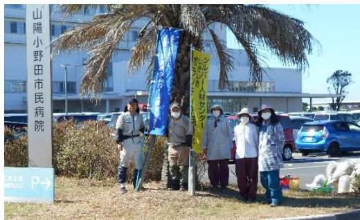
▲市民病院駐車場除草