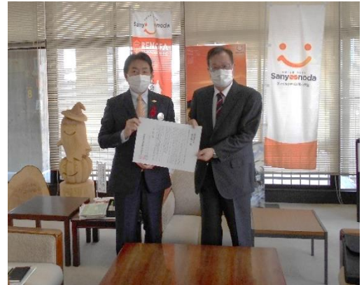
▲藤田市長へ要望書提出