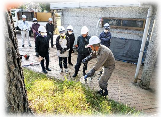
▲ 刈払機の取り扱い方