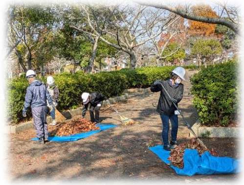
▲ 落ち葉清掃の体験