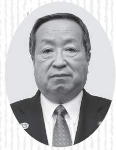
公益社団法人 銚田市シルバー人材センター 理事長