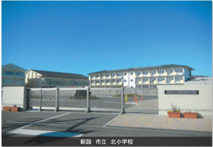
新設 市立 北小学校