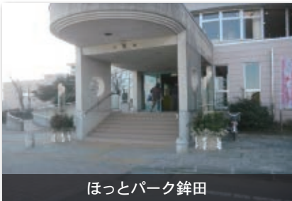
ほっとパーク銚田