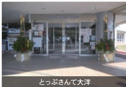
とつぷさんて大洋