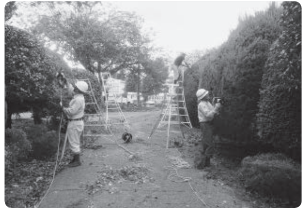
来季の講習会も期待しています。