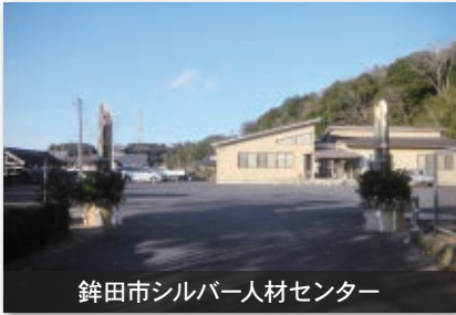
銚田市シルバー人材センター