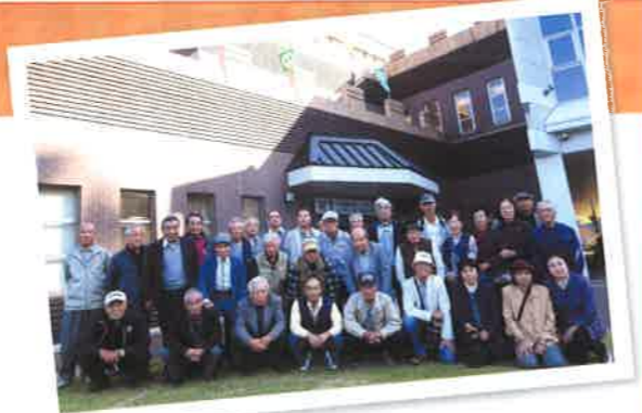
村上海賊ミュージアムに於いて

四国愛媛県西条市にある「アサヒビール」の工場見学に行きました。ビールのできる工程を見学の後は 同所のレストランでバイキングを楽しみました。勿論「ビール」も！ 今治市大島の「村上海賊ミュージアム」に立ち寄り、瀬戸内海における能島村上海賊の活躍を学びました。