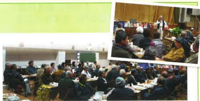
福祉会館「大ホール」に於いて