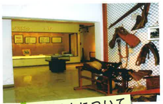
仁科博士について