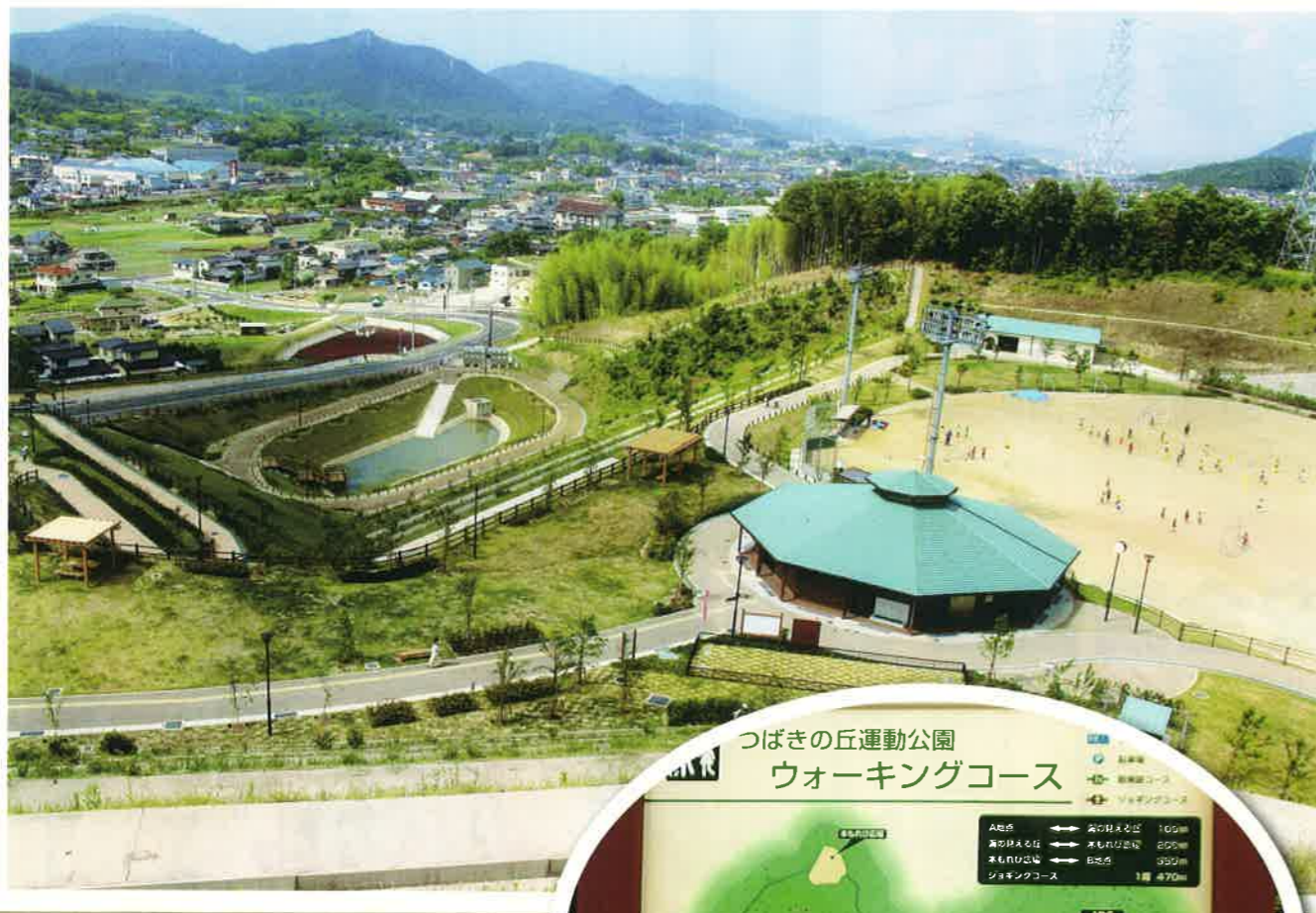
海に見える丘から見た町内の景色