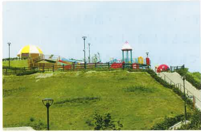
運動公園遊具（管理棟南下）