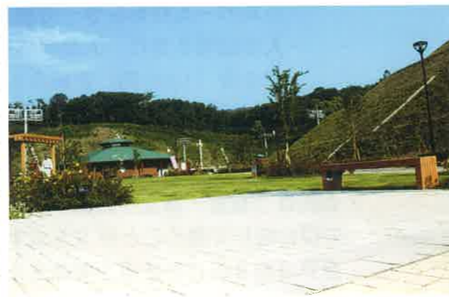
駐車場から見た管理棟