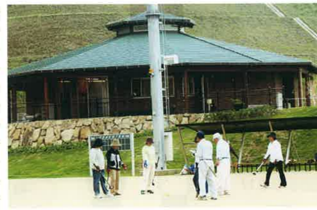
グランドゴルフを楽しむ