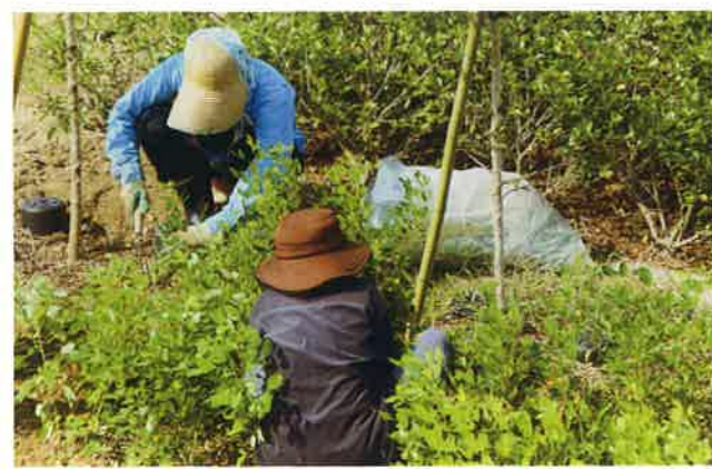
シルバー草取り作業