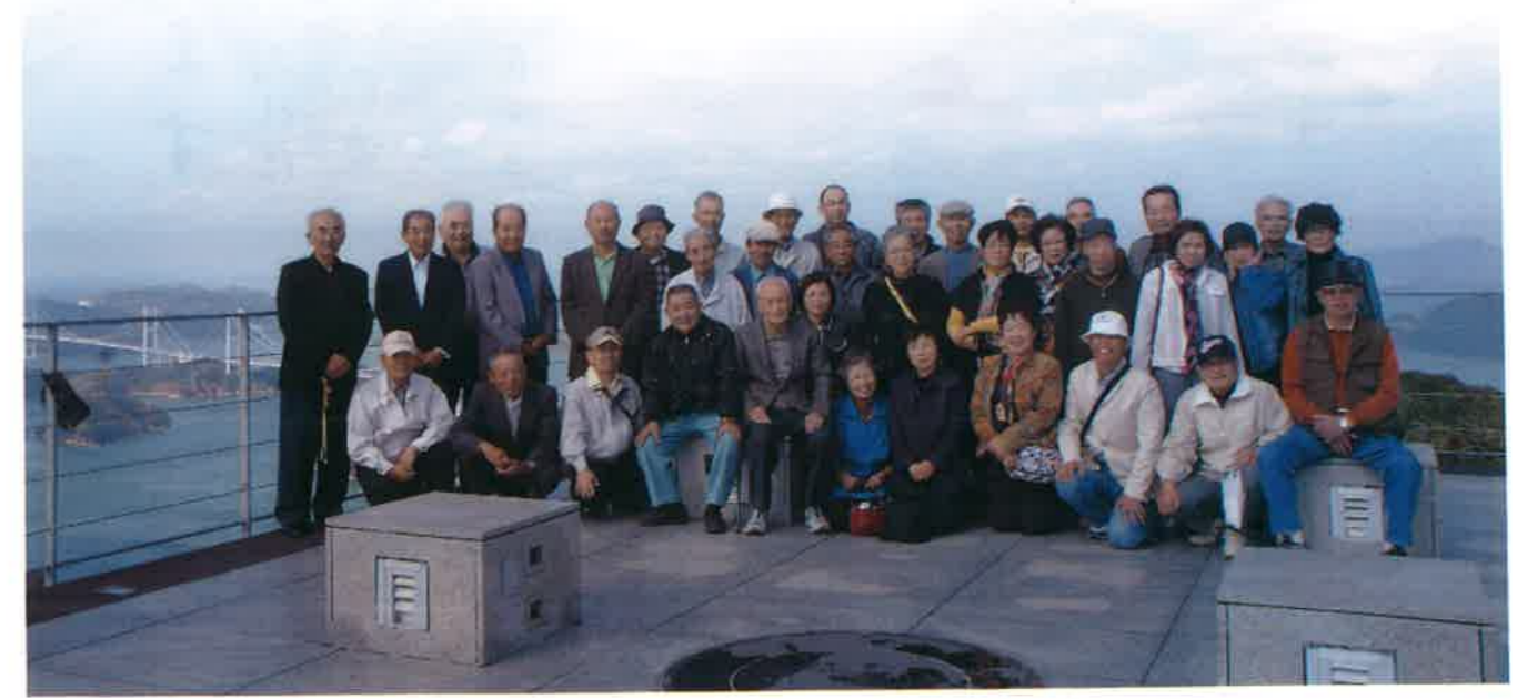
平成23年10月27日 研修旅行(愛媛県 亀老山展望公園にて)