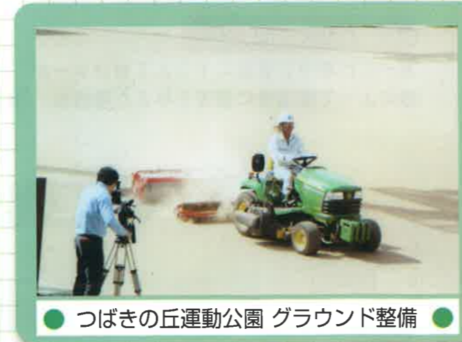
● つばきの丘運動公園 グラウンド整備 ●