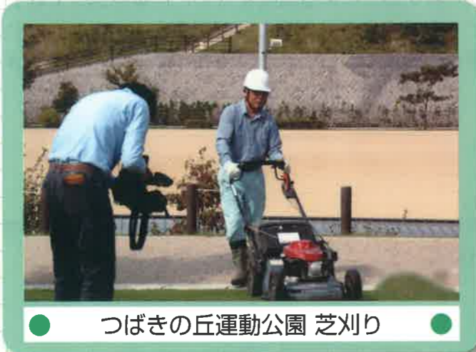
● つばきの丘運動公園 芝刈り ●