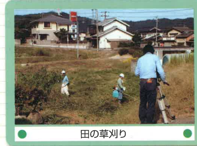
● 田の草刈り ●