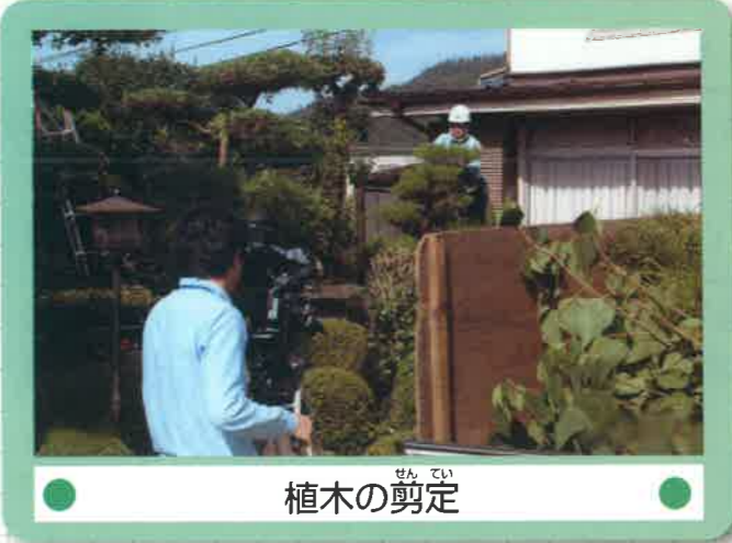
● 植木の剪定 ●

平成23年12月7日 笠岡放送にて放映されました。 写真は、放映の為に撮影準備をしているところです。