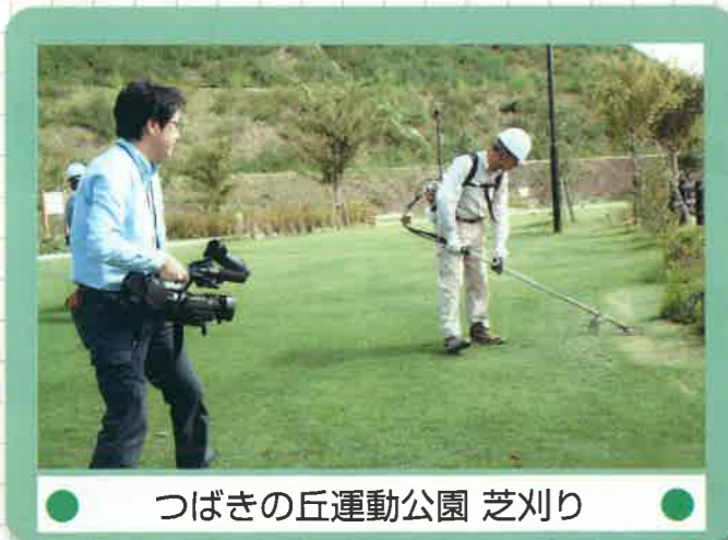
● つばきの丘運動公園 芝刈り ●