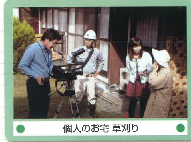
● 個人のお宅 草刈り ●