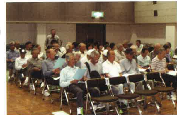
平成27年度 定時総会

さて、わが国における高齢者を取 り巻く社会環境は、「団塊の世代」 が六十五歳に達したことにより、本 格的な高齢者社会を迎えておりま す。そして、六十五歳以上の高齢 者の再就職は他の年齢層に比べ厳し い状況にあるようございます。 そうした中、会員の加入状況は全 国的に減少の傾向はとどまらず当セ ンターにおいても新規加入会員の大 幅な増加は望めず、会員の確保に大 変苦慮しているところでございま す。