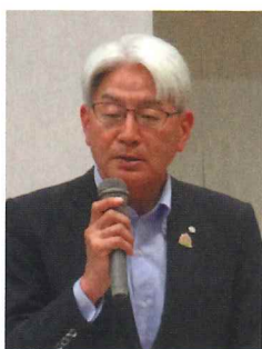
来賓祝辞 加藤泰久町長