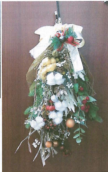
クリスマススワッグ