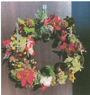
クリスマスリース