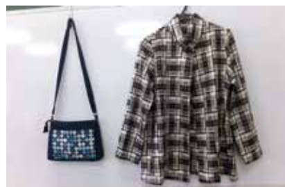
ジャケットとバック 入曾4班 國村トキ子氏作