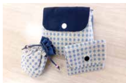
ポーチセット 狭山台5班 柴田三枝子氏作