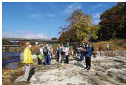
矢嵐(やおろし)凝灰岩