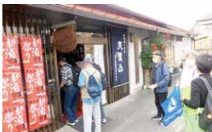
五十嵐酒造(天覧山の蔵元)ここで、試飲 100円