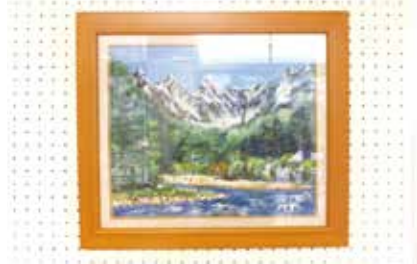
絵画 上高地 入曾13班 利重正司氏作