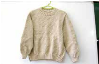
セーター 水富5班 石川ヒサ子氏作