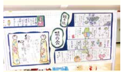
絵手紙 1 萌の会