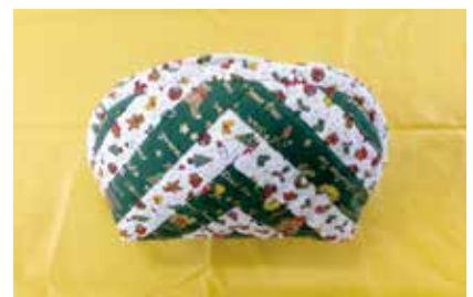
キルトポーチ 奥富3班 山崎久美子氏作