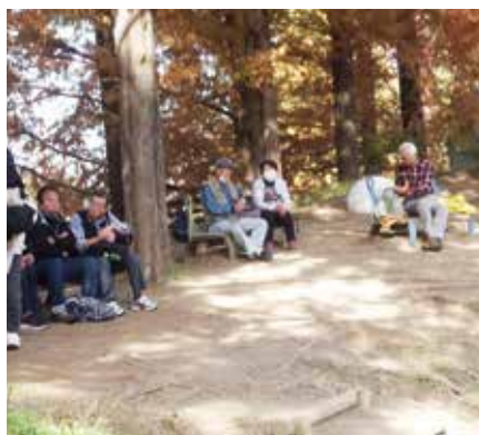
思い思いの場所で昼食