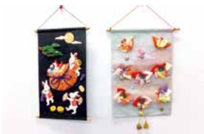
タペストリー2点 入間川4班 平久早苗氏作