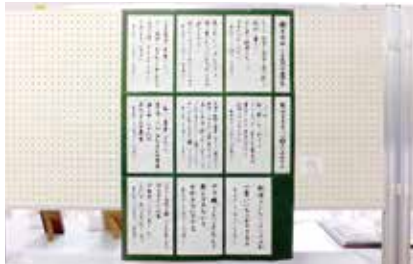
書 樹木希林 120の遺言 入間川東9班 平山範明氏作