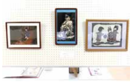
切り絵 慈母観音と子どもたち 入曾18班 坂地ユリ子氏作