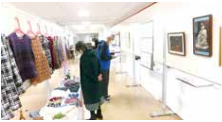
作品展示会会場の雰囲気