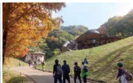
トーベ・ヤンソン 左:きのこの家 右:子ども劇場