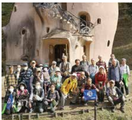
集合写真(きのこの家の前)