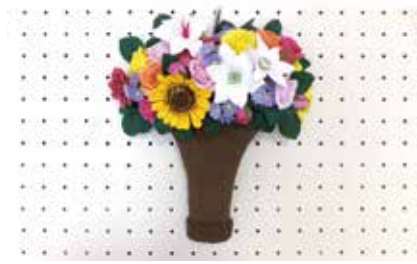
造形 花かご 入曾5班 川崎眞理子氏作