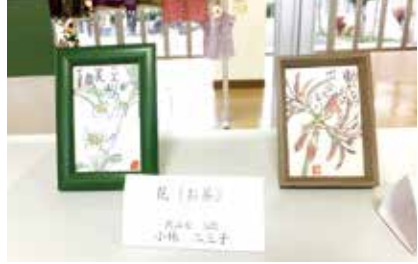
絵手紙 花(お茶)・花(彼岸花) 狭山台5班 小林二三子氏作