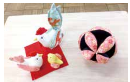
とりの家族・まり 入曾11班 浦美奈子氏作