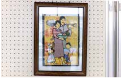
切りはり絵 家庭菜園 狭山台2班 竹本隆志氏作