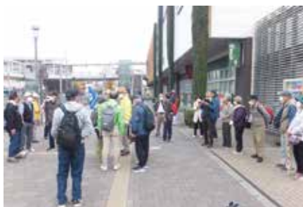
狭山市駅西口集合 9:00

※「水辺の小径」は、春は桜、秋は曼殊沙華群生地(真善美の小径)と四季を通じて楽しめ、「阿須の鉄橋」は撮影スポットです。 シルバー親睦会幹事