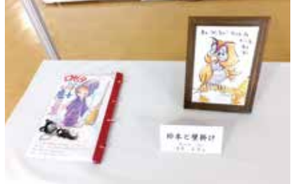
絵本 壁掛け 狭山台7班 酒井美津江氏作