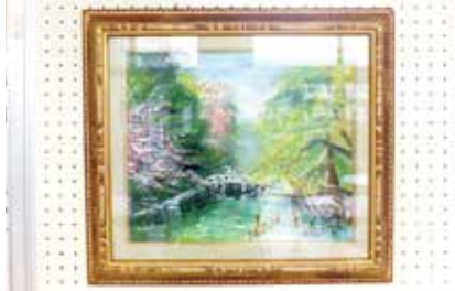
絵画 燦燦 入曾13班 利重正司氏作