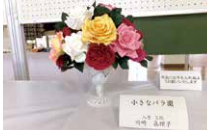
造形 小さなバラ園 入曾5班 川崎眞理子氏作