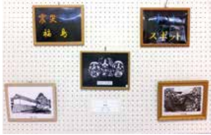
切り絵 福島 狭山台8班 山本八四郎氏作