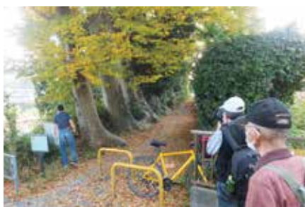
飯能の大ケヤキ根本(神明神社)