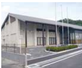
▲狭山市立武道館外観