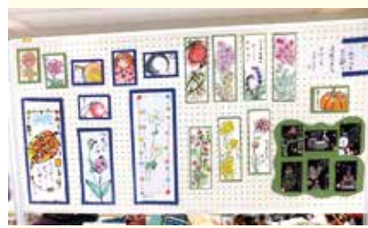
絵手紙 3 萌の会