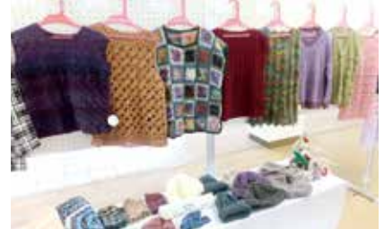
編み物班：石川ヒサ子氏作 師岡芳子氏作 高橋寿美子氏作 湯本路子氏作 福原富士江氏作