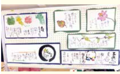
絵手紙 2 萌の会