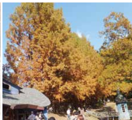
メタセコイヤの大木