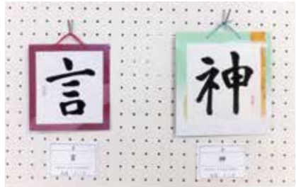
書 言神 特別参加 大塚クニ子氏作