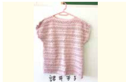
ベスト 入間川6班 諸井芳子氏作