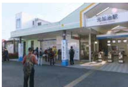
元加治駅前に集合&解散 14:00頃