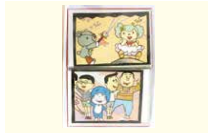
切りはり絵 アルバム 狭山台2班 竹本隆志氏作