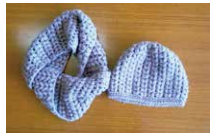
帽子とマフラー 水富10班 福原富士江氏作