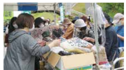
親睦会各種グッズ販売