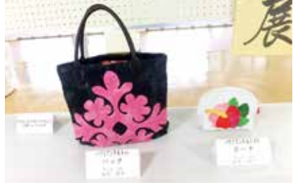
ハワイアンキルトのポーチ&バッグ 狭山台2班 坂井律子氏作