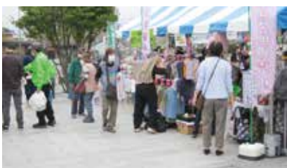
手作り班、編み物班作品販売

れないけど、手づくりが好きでよく買うの」と話す人、特に「今度いつやるの?えー来年まで待つ」と言ってくださったお客様の言葉は印象的でした。そして作品の仕上りの良さ、センスの良さを褒めていただき嬉しかったです。この様なお客様との会話は、これからの作品づくりの参考にも、励みにもなります。 手作り班一同お客様のニーズに合ったものづくりに、そしてさらなるレベルアップに心がけたいと思います。 最後に、開催に向けてご尽力いただいた主催の皆様に感謝いたします。