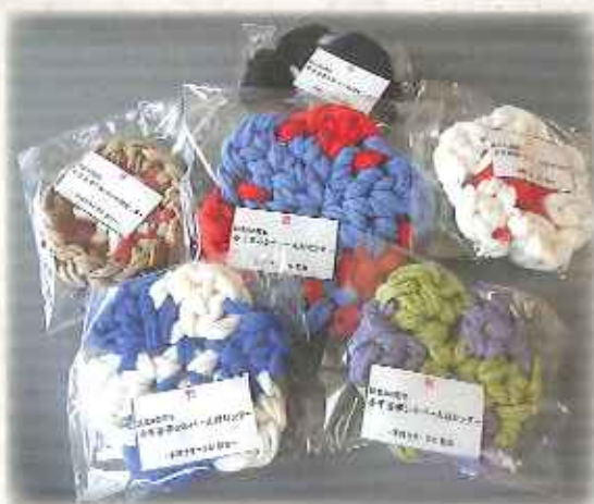
出席者への記念品のコースター▶