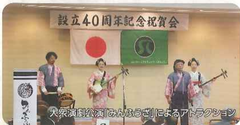
大衆演劇公演「みんなうざ」によるアトラクション