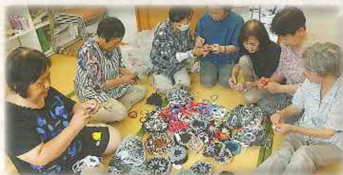
▲「手作りサークル」による記念品制作のようす