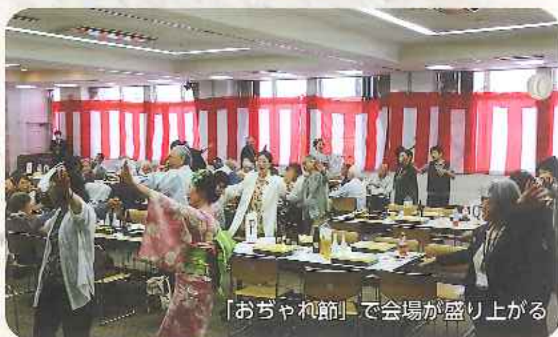
「おぢゃれ節」で会場が盛り上がる